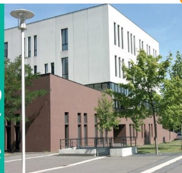
Université Paris-Est Créteil

stage conseil job alternance documentation lettre de entretien candidature orientation